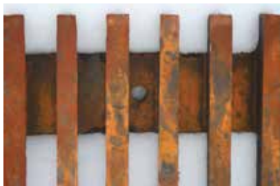
Moldeo en una sola pieza.